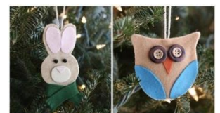
No-Sew Felt Ornaments